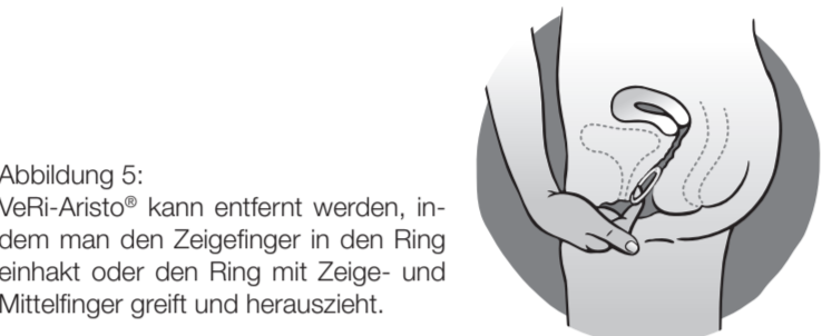
Abbildung 5: VeRi-Aristo® kann entfernt werden, indem man den Zeigefinger in den Ring einhakt oder den Ring mit Zeige- und Mittelfinger greift und herauszieht.

Legen Sie den Ring mit einer Hand in die Scheide ein (Abbildung 4A); falls notwendig, können die Schamlippen mit der anderen Hand gespreizt werden. Schieben Sie den Ring in die Scheide, bis er sich angenehm eingepasst anfühlt (Abbildung 4B). Lassen Sie den Ring für 3 Wochen in dieser Position (Abbildung 4C).