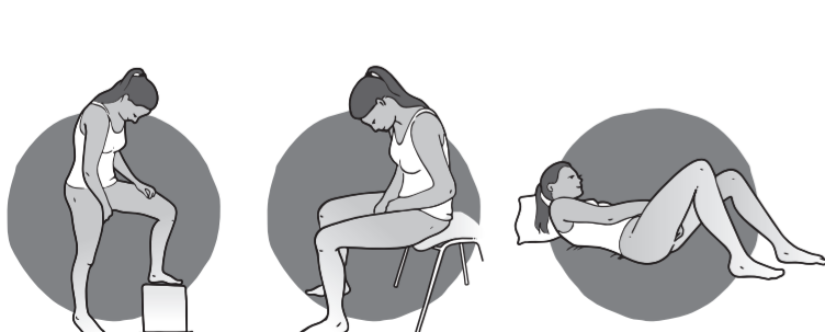
Abbildung 3 Nehmen Sie zum Einlegen des Rings eine bequeme Haltung ein.