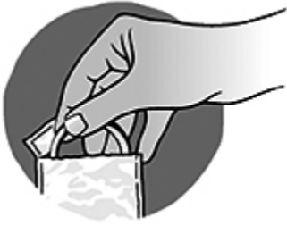
Abbildung 1 Nehmen Sie VeRi-Aristo aus dem Beutel.