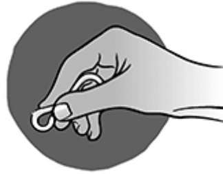
Abbildung 2 Drücken Sie den Ring zusammen.